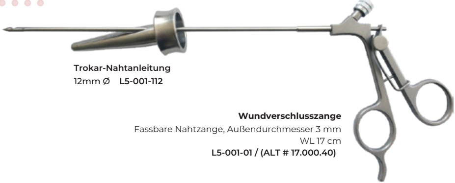
Trokar-Nahtanleitung 12mm Ø L5-001-112