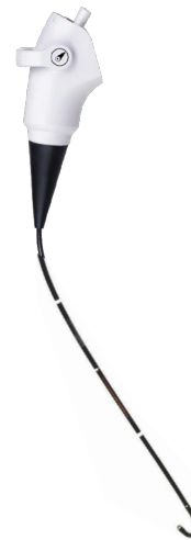
Einwegartikel: S-32FD Wiederverwendbar: S-32FR