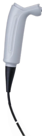
Wiederverwendbarer Griff : E-HR

Der ultrafeine, glatte Einführschlauch macht den Patienten "unempfindlicher"