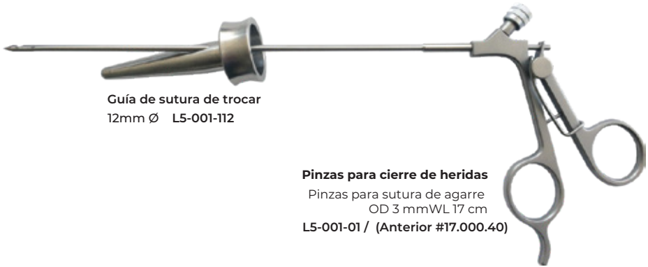
Guía de sutura de trocar 12mm Ø L5-001-112