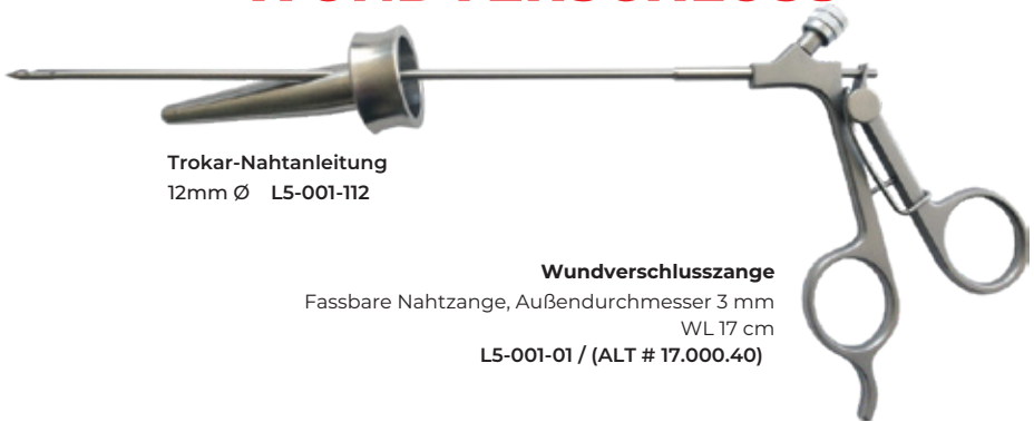
Trokar-Nahtanleitung 12mm Ø L5-001-112